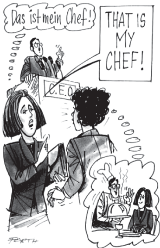
Auf die Sprache kommt es an, ganz besonders beim Humor.

Herzhaftes Lachen beansprucht 17 Gesichtsmuskeln und sportliche 80 Muskeln insgesamt. Lachen ist eine universelle Sprache - erfrischend, befreiend und entspannend. Es ist ansteckend. Niemand kann ihm widerstehen. Doch verschiedene Kulturen lachen über unterschiedliche Dinge.